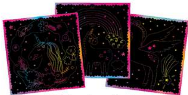
3 láminas de scratch art pre-cortadas